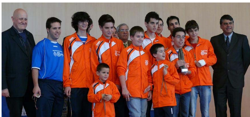
EVA Manises, campeón 2011

Salones de juego: GRAN HOTEL BALI; C/- Luis Prendes s/nº - Benidorm.